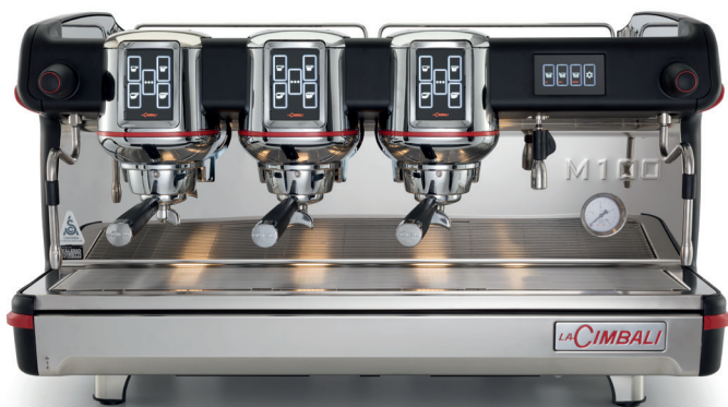
M100 Attiva DT3 bottoni