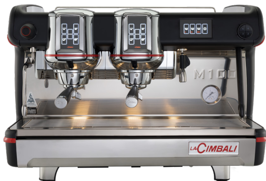
M100 Attiva DT2 touch