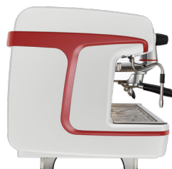
Bianco lucido Glossy white