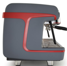
Grigio opaco Matte Grey