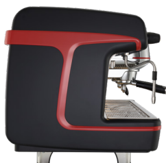
Nero opaco Matte black