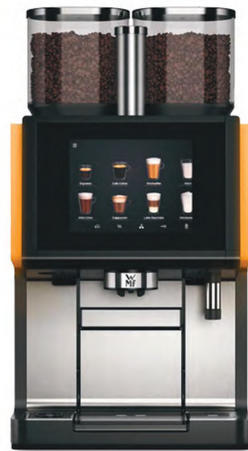
WMF 9000 S+