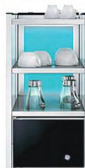
LODÓWKA NA MLEKO Z PODGRZEWACZEM FILIŻANEK

LODÓWKA Z WYJMOWANYM ZBIORNIKIEM NA MLEKO O POJEMNOŚCI 9,5 L, PODŚWIETLENIE, ZAMEK, WYMIENNA USZCZELKA DRZWI, 230 V, 2 WERSJE: - WĄSKA, 3 PODGRZEWANE PÓLKI, 286X566X530 MM (S,G,W) - SZEROKA, 2 PODGRZEWANE PÓLKI, 368X567X530 MM (S,G,W)