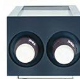
PODAJNIK NA KUBKI PAPIEROWE

POJEMNOŚĆ 6,5 L, WYJMOWANY ZBIORNIK, ZAMYKANA, WYMIENNA USZCZELKA DRZWI 228X463X392 MM (S,G,W) 230 V