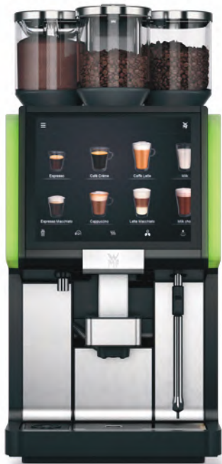
WMF 5000 S+