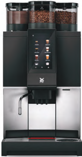
WMF 1300 S