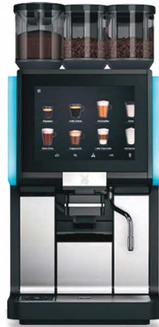
WMF 1500 S+